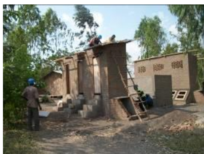
Ecole Primaire de Maramvya 1 en cours de construction

été légèrement retravaillé : il est maintenant constitué de deux blocs distincts, l'un pour les garçons, l'autre pour les filles ; pour « les petits besoins », des urinoirs pour garçons et pour filles ont été construits à côté des cabines ; enfin, l'ouvrage dans son ensemble est plus aéré.