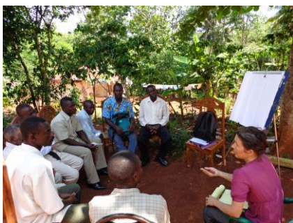
Animation PHAST à l'école Maranatha de Marion, avant la construction des 6 latrines et la réfection de la citerne.

A l'école de la Voix des Anges, le comité et PAD collaborent sur le projet de la récolte des eaux de pluie et la construction d'une citerne.