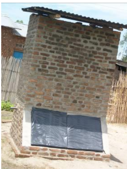
Latrine ecosan ménage avec superstructure en briques

Comme pour toutes les réalisations entreprises dans le cadre de ce programme, les ménages participent en fournissant tous les matériaux locaux (sable, gravier, briques en adobe) et la main d'œuvre. Ils doivent également s'organiser eux-même pour construire la superstructure de leur latrine. Le programme, quant à lui, apporte les matériaux importés (ciment, fer à béton, bâches) et la supervision technique. Pour le