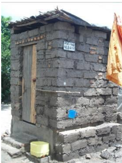
Latrine ecosan ménage avec superstructure en adobe (terre)

généraliser la réalisation des latrines « ecosan à déshydratation » au niveau des ménages . Le défi a été relevé puisqu'un design à la fois techniquement viable et financièrement accessible pour les populations a été trouvé.