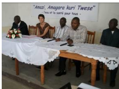
Inauguration du projet déchets financé par l'AFD et l'AWAC

Ce projet financé par l'AFD/AWAC a été inauguré en février 2013 pour une durée de trois ans. Outre la construction de latrines « ecosan », il comporte d'autres volets d'action dans le domaine de la gestion des déchets solides et liquides , notamment la mise en place de « Comité Hygiène et Assainissement » dans les communautés, et d'Activités Génératrices de Revenus (AGR) dans le domaine du recyclage des déchets et de l'assainissement en général ; la réalisation de « compostières » dans les ménages, ou encore l'élaboration de plans communaux dans le domaine de l'assainissement ainsi que la formation des agents de la commune en charge de l'assainissement.