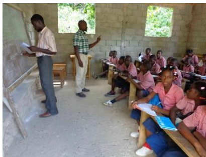
Animation PHAST à l'école du Bon Samaritain à Fond'Icaques