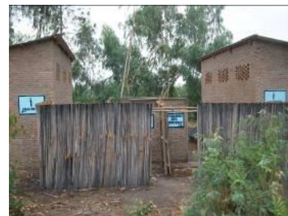
Ecole Primaire de Maramvya 1 fin prête pour la rentrée de sept. 2013

de lancer les « sessions Eau Assainissement Hygiène » hebdomadaires dans chaque classe des écoles d'intervention. Les nouveaux professeurs ont également été formés à l'encadrement de ces sessions.