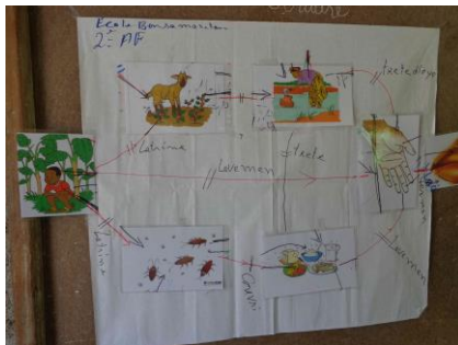
Carte des chemins de contamination, réalisée par les élèves de l'école du Bon Samaritain

Durant toute l'année, PAD Haïti continue à diffuser des spots sur l'hygiène et la santé sur toute la Grand'Anse grâce à notre partenaire local Im@gine FM. Un spot est diffusé toutes les heures. En avril, les spots conçus depuis septembre 2012 ont été améliorés et 8 spots ont été ajoutés. Au total, 22 spots abordent 7 thèmes différents : l'hygiène de l'eau, de l'environnement, l'hygiène alimentaire, le lavage des mains, l'usage des latrines, les comportements à adopter lorsque les enfants souffrent de diarrhée. Ecoutez-en quelques-uns en visitant le site web de PAD . Toujours conçus en créole, ils délivrent des messages simples et clairs sur les règles d'hygiène.