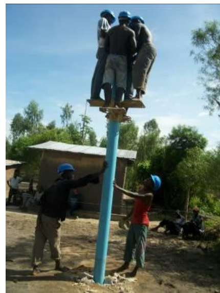
Réalisation du forage de Maramvya 12

Sur le volet eau, le projet poursuit également son cours avec la réalisation d'un nouveau forage manuel de faible profondeur à Maramvya 12, une colline qui n'a jusqu'à présent aucun accès à l'eau. Le point d'eau est en cours de finalisation : il fait 23m de profondeur et la pompe devrait être installée courant octobre.